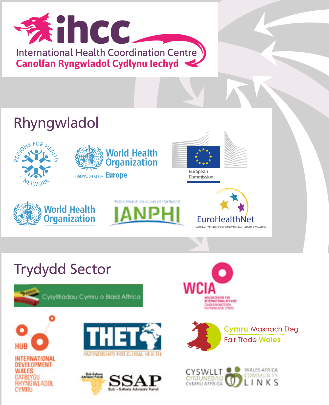
Ffigur 2. Map rhanddeiliaid y Ganolfan

Mae'r IHCC wedi llwyddo i sefydlu rhwydwaith cryf o randdeiliaid allweddol sy'n gysylltiedig â datblygu a gweithredu ein rhaglen waith (Ffigur 2).