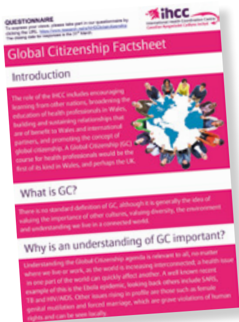
Ffigur 3. Taflen wybodaeth ar Ddinasyddiaeth Fyd-eang a anfonwyd at staff

Mae angen annog a chefnogi gweithwyr iechyd Cymrus i ddatblygu rolau priodol sy'n rhoi buddion personol, sefydliadol ac ehangach i Gymru a'i phartneriaid rhyngwladol.