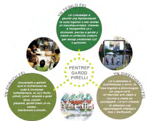
Figur 2: Pentref Gardd Pirelli [105, t.25]