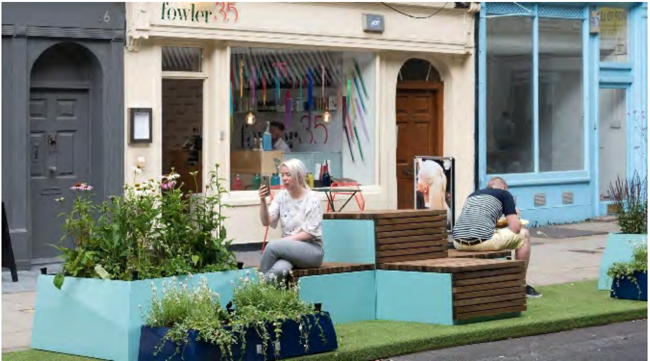
Ffigur 4: Fitz Park Llundain https://www.arup.com/projects/fitzpark

Creodd y prosiect hwn barc bach yn yr hyn a oedd yn arfer bod yn gilfach lwytho ar stryd brysur yn Llundain. Darparodd hyn le i'r gymuned leol, gweithwyr ac ymwelwyr ymlacio, cael saib a chymdeithasu. Mae'n enghraifft o 'wyrddni trefol' a all gyfrannu at deithio llesol a llesiant.